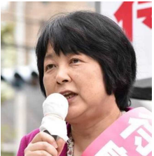
無所属 会派・新しい風

穏やかな元旦を迎え、新しい年が始まりました。 気持ちを新たに、この一年も真摯に課題に取り組んでまいります。 皆様にとって、幸多き年となりますよう、お祈りいたします。